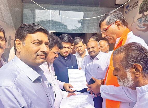
भिवानी। एक देश एक चुनाव को लेकर मांगपत्र सौंपते सामाजिक संगठन के सदस्य।

देश में एक देश-एक चुनाव की अवधारणा को लागू करने की बढ़ती बहस के बीच विभिन्न सामाजिक संगठनों ने इस महत्वपूर्ण सुधार के समर्थन में आवाज बुलंद की है। मंगलवार को विभिन्न सामाजिक संगठनों के एक प्रतिनिधिमंडल ने भिवानी के उपायुक्त के माध्यम से राष्ट्रपति के नाम ज्ञापन सौंपा, जिसमें जिला की विभिन्न पंचायतों और संस्थाओं द्वारा पारित किए गए एक देश-एक चुनाव के समर्थन वाले प्रस्ताव शामिल हैं। उपायुक्त को सौंपे