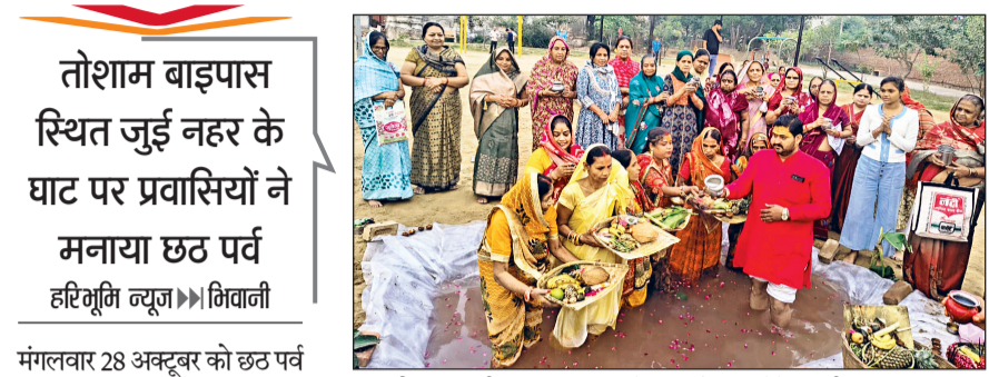
भिवानी। अस्थायी कुंड बनाकर उगते सूर्य को अर्घ्य देते प्रवासी महिला व पुरुष।

तोशाम बाइपास स्थित जुई नहर के घाट पर प्रवासियों ने मनाया छठ पर्व