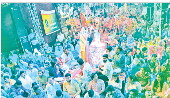
भिवानी। लोहड़ चौपाटा में श्रीश्याम बाबा के जन्मदिन कार्यक्रम में उमड़ी भीड़।

कृपा सांवर की परिवार भिवानी द्वारा आयोजित मेरे श्रीश्याम का जन्मदिन धार्मिक समारोह श्रद्धा और भक्ति के अद्भुत संगम के रूप में संपन्न हुआ। लोहड़ चौपाटा परिसर में आयोजित आयोजन में क्षेत्रभर से भारी संख्या में श्याम प्रेमी पहुंचे और देर रात तक श्याम नाम की महिमा में डूबे रहे। कार्यक्रम की शुरुआत शाम सवा 6 बजे श्रीश्याम की आरती और द्वीप प्रज्वलन से हुई। इसके पश्चात मंच