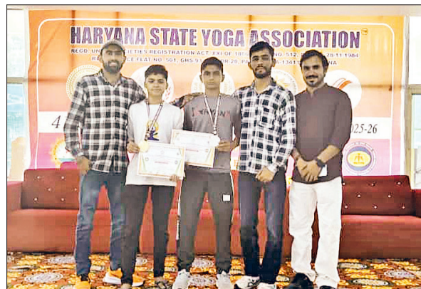
मिवानी। पदक विजेता खिलाड़ियों का स्वागत करते खेलेप्री।

राज्य स्तरीय प्रतियोगिता में मिवानी के योगियों का शानदार प्रदर्शन