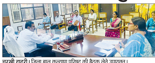
घरखी दादरी। जिला बाल कल्याण परिषद की बैठक लेते उपायुक्त।

उपायुक्त डॉ. मुनीश नागपाल की अध्यक्षता में जिला बाल कल्याण परिषद की बैठक आयोजित की गई। उपायुक्त ने नवनिर्वाचित बाल कल्याण समिति के सदस्यों के साथ विभिन्न विषयों पर बातचीत की। उन्होंने कहा कि जिला बाल कल्याण परिषद की गतिविधियों बच्चों की भलाई व उज्ज्वल भविष्य के लिए होती हैं। इनके लिए अधिक से अधिक संसाधन होने जरूरी है।