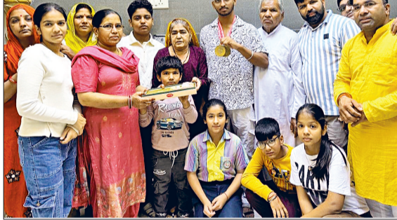
भिवानीखेड़ा। खिलाड़ी का स्वागत करते हुए।