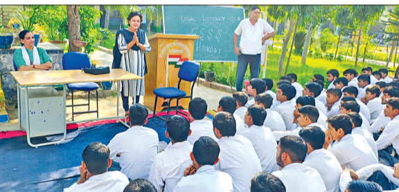
बाढ़ड़ा। हड़दी स्कूल में जागरूकता कार्यक्रम में बच्चों को संबोधित करते अतिथि।