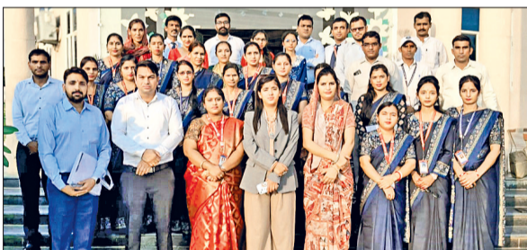
तोशाम। प्रशिक्षण के दौरान मौजूद शिक्षक।

आदर्श कांवेण्ट स्कूल कैरु के सभागार में शिक्षक प्रशिक्षण कार्यशाला का आयोजन हुआ, जिसमें कला समेकीकरण के माध्यम से शिक्षण अधिगम कार्य को उत्कृष्ट एवं रोचक बनाने की कला संबंधित आंतरिक शिक्षक प्रशिक्षण दिया गया। सीबीएसई के निर्देशानुसार प्रत्येक अध्यापक-अध्यापिका को 50 घंटे का प्रशिक्षण प्राप्त करना अनिवार्य है। प्रशिक्षण में से 25 घंटे सीबीएसई द्वारा आयोजित क्षमता संवर्धन प्रशिक्षण तथा 25 घंटे का आंतरिक प्रशिक्षण शामिल है।